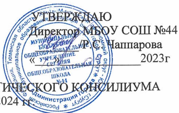
ГРАФИК ЗАСЕДАНИЙ ПСИХОЛОГО - ПЕДАГОГИЧЕСКОГО КОНСИЛИУМА МБОУ СОШ №44 на 2023-2024 г.