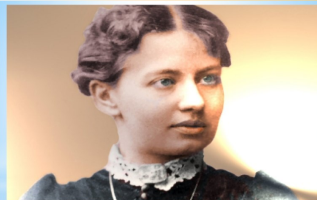
Софья Васильевна Ковалевская

Софья Васильевна Ковалевская - первая женщина-профессор и профессор математики в России и в Северной Европе. Она одна из самых известных русских женщин-ученых. Работала в сфере математической физики, небесной механики и теории потенциала. Получила премии Парижской академии наук и Шведской академии наук.