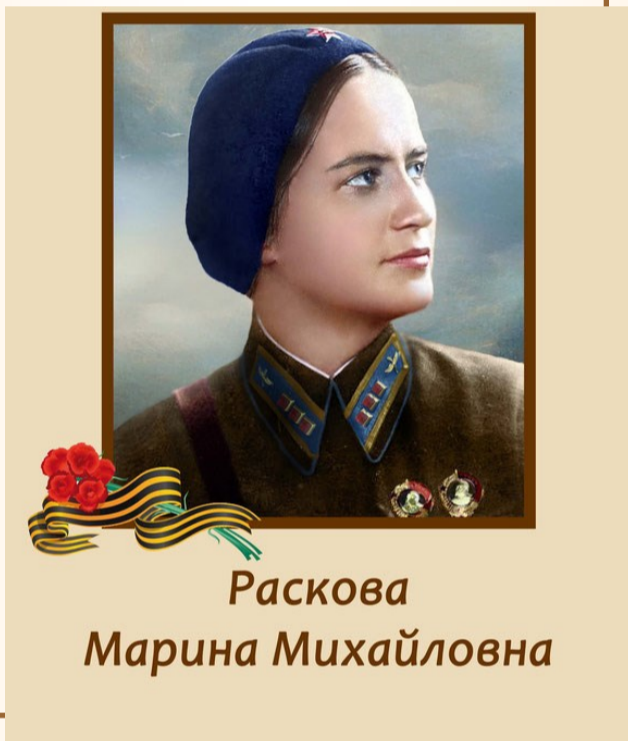
Раскова Марина Михайловна

Марина Михайловна Раскова - одна из первых женщин, удостоенных звания Героя Советского Союза, майор воздушных сил Красной армии, летчица-штурман. Установила женский мировой авиационный рекорд дальности полёта по прямой, благодаря своему знаменитому полёту. Так же ей вручили медаль "Золотая звезда", которую впервые в истории присвоили женщине.